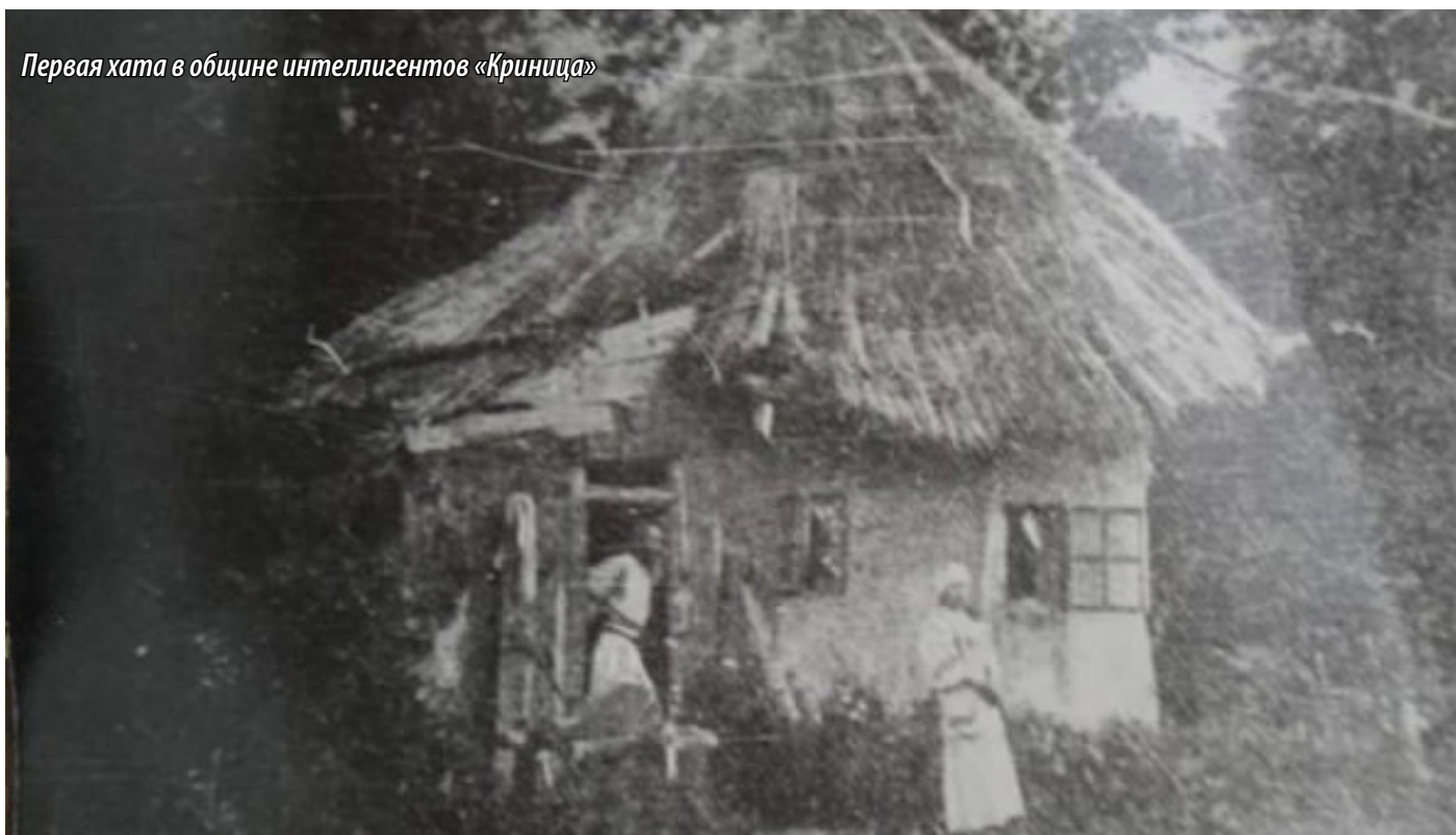
Первая хата в общине интеллигентов «Криница»

Одна из трудностей восстановления картины развития коммунитарного движения в 1901-1917 гг. связана с заметным ослаблением внимания к нему Департамента полиции. С одной стороны, это объясняется большей, чем прежде, социальной напряженностью данного периода истории России, когда это внимание привлекали к себе иные, значительно более неблагонадежные в общественно-политическом отношении силы. С другой стороны, коммунитарное движение для царской полиции, наблюдавшей за созданием и распадом общин уже около 20-ти лет, перестает быть чем-то новым и подозрительным. Постепенно познакомившись с деятельностью коммунитариев, полицейские чиновники убеждаются в ее безвредности для существующего государственного строя. Например, наблюдатель общины интеллигентов «Криница» уже в 1897 г. пришел к выводу, что «если действительная цель существования