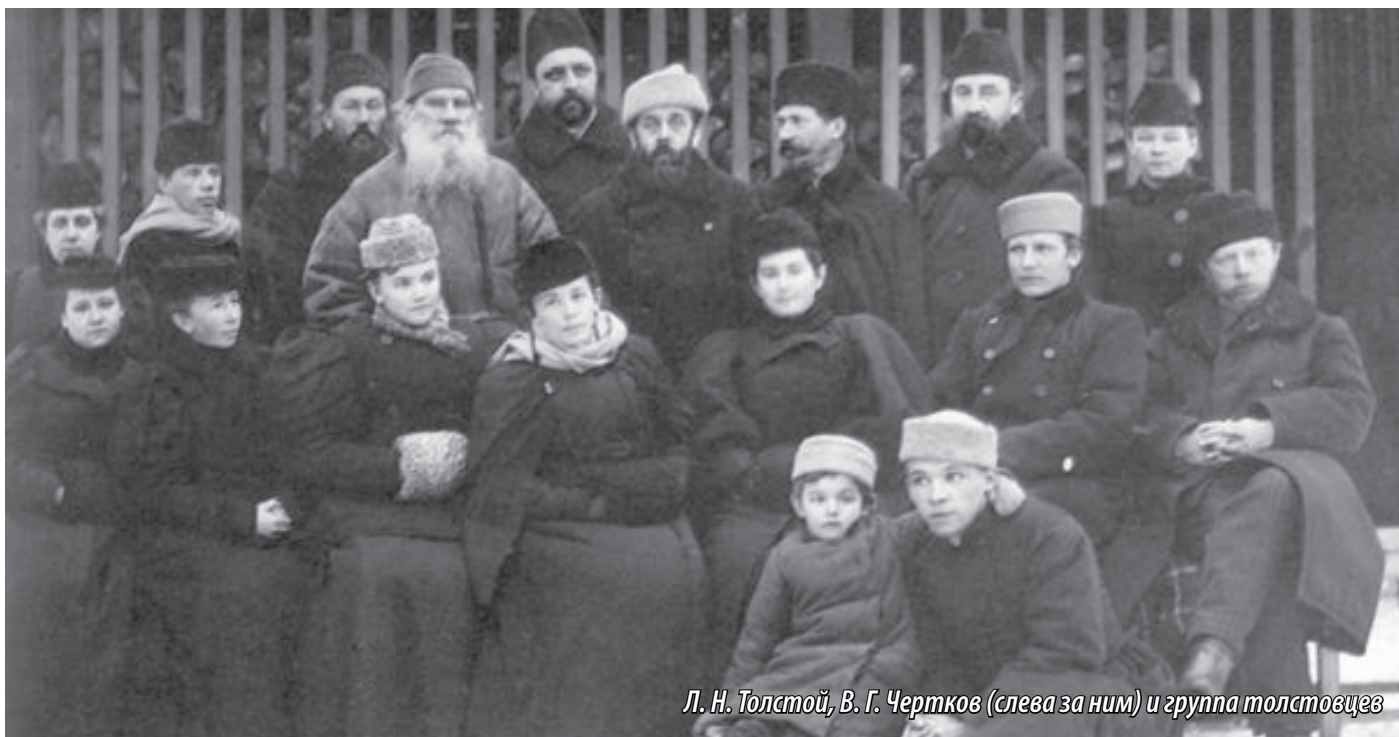
Л. Н. Толстой, В. Г. Чертков (слева за ним) и группа толстовцев